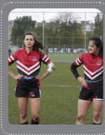
DAMES 1 1ste divisie National league