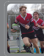
IDES CUYLITS U17 Nationale selectie