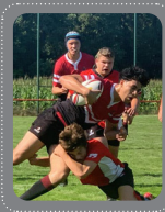
U18 2de divisie National league