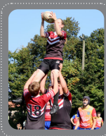
U16 1ste divisie National league