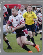
HEREN 1 3de divisie National league